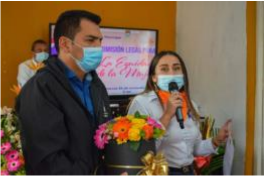
Evidencia informe de autoevaluación y el control 2021 SESAD

-Se realizó seguimiento a las acciones y estrategias implementadas hacia la erradicación y prevención de la violencia en contra de la mujer, asistencia y convocatoria del conversatorio de violencias basadas en género, delitos sexuales y violencia intrafamiliar, presentación rendición de cuentas y plenario concejo municipal.