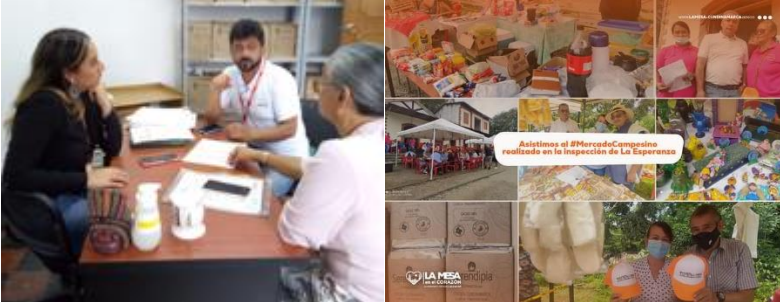
Evidencia organización y apoyo inspección la esperanza 2022 SESAD

Proyectada desde el año 2022 en articulación con la secretaria de Desarrollo Económico y Turístico y la secretaria de educación, cultura y juventud se realizó capacitación con las mujeres pertenecientes a la inspección de La Esperanza, en temáticas de experiencias sensitivas y línea del tiempo a fin de generar una vinculación del museo y los recorridos de la vía férrea desde el proyecto del corredor verde, se realizo apoyo a espacios de comercialización de productos en la inspección.