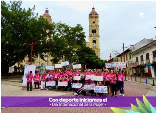
Evidencia informe de autoevaluación y el control 2023 SESAD

Se desarrolló el homenaje a la mujer mesuna, con presentaciones artísticas y culturales, mariachi, artista musical, danzas, premios y feria de servicios de salud dirigido a las mujeres, con atención en examen de seno, citología, nutrición, psicología, orientación con comisaria de familia y espacios deportivos con zumba, en articulación con el equipo psicosocial de la secretaria de educación se realizaron talleres con los estudiantes en relación a los derechos de las mujeres, así mismo se ejecutó el encuentro provincial de mujeres "La Mesa hecha a mano" en el aniversario 246 del Municipio.