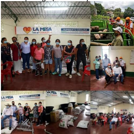
Evidencia entrega de insumos a 5 proyectos productivos 2021 SESAD

Proyectada desde el año 2021 se realizó la implementación de 5 proyectos productivos de mujeres emprendedoras, entrega de insumos aves ponedoras, cerdas de cría, alimentos, y material para fabricación de unidad para grupos de mujeres de la zona rural del Municipio y madres cabeza de hogar.