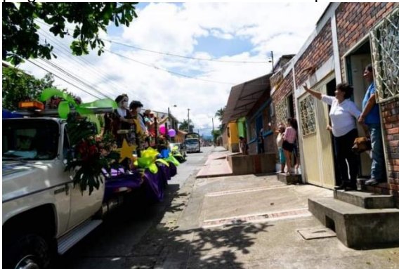
Evidencia día de la mujer 2020 SESAD

-Se realizó la conmemoración del día internacional de la mujer con evento público, caravana, carrera de la mujer, entrega de incentivos para mujeres, conversatorios; así mismo se ejecutó el encuentro denominado "expo mujer", espacio para la comercialización de productos y proyectos de mujeres emprendedoras y se realizó la conmemoración del día internacional de la eliminación de la violencia contra la mujer mediante mediante programa radial dadas las circunstancias por COVID-19