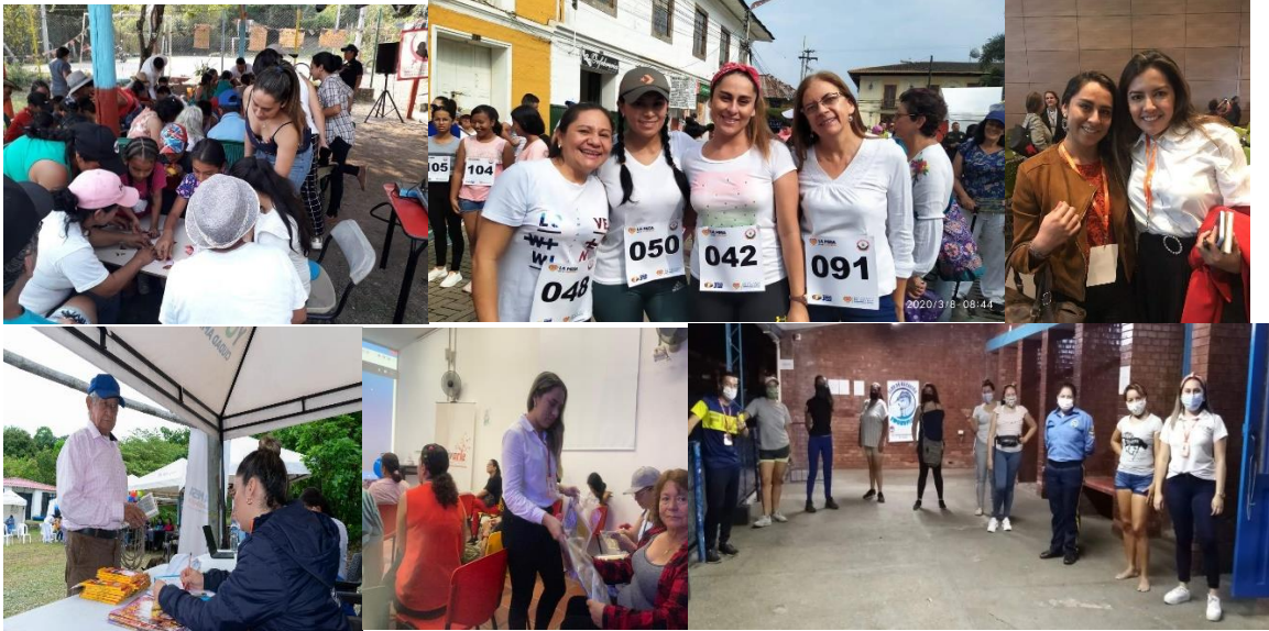
Evidencia obligaciones enlace mujer SESAD

Desde el año 2020 anualmente se genera el proceso contractual del enlace de mujer y género para el Municipio de la mesa quien cuenta con obligaciones específicas enfocadas al desarrollo del programa LA MUJER EN EL CORAZÓN con 20 metas orientadas a la implementación de la política Pública de Mujer y Género para el Municipio de La Mesa, y quien lidera, articula y gestiona estrategias, actividades y espacios para el beneficio de las Mesunas y su entorno.