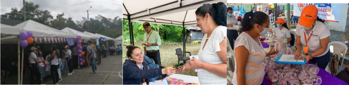
Evidencia brigadas lo social a casa SESAD

Durante el cuatrienio anualmente se realiza la contratación de la profesional en psicología para el apoyo a comisaria y la implementación de la estrategia " comisaria a casa" con el objetivo de generar prevención, promoción y socialización de las acciones de la comisaría en todos los contextos, tipos de violencia, pautas de crianza y orientación en rutas de atención municipal, orientando a las mujeres de la zona rural en cada una de las brigadas de lo social a casa.