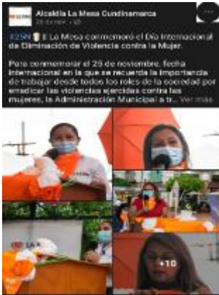
Evidencia informe de autoevaluación y el control 2021 SESAD

- Se realizó conmemoración del día internacional de la mujer mediante estrategia "Mujer que inspira" donde se busca exaltar el papel de las Mesunas en la sociedad e inspirar a otras mujeres, a través de la creación de crónicas que permitan conocer la labor que desempeña cada una de las mujeres elegidas mes a mes y que han contribuido al bienestar de los Mesunos desde diferentes ámbitos, el reconocimiento a la mujer que inspira 2021 se realizó mediante concurso virtual, se ejecutó la segunda versión del encuentro de mujeres emprendedoras en el marco del día de la mujer rural; en relación al ámbito salud se ejecutó brigada en el día internacional de la lucha contra el cáncer de seno con feria de servicios en salud, para el 25 de noviembre se realizó velatón en conmemoración a las víctimas de violencia y se dio espacio a la segunda versión de la carrera de la mujer.