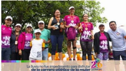
Evidencia carrera de la mujer 2023 SESAD