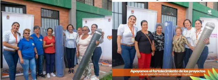
Evidencia entrega donaciones emprendimiento inspección la esperanza 2023 SESAD

Se realizo entrega de insumos (telas) a la asociación de mujeres tejiendo sueños y esperanzas para el desarrollo de sus proyectos productivos enfocados en la reactivación y turismo de la inspección y se adelanta proceso contractual para el fortalecimiento de grupos de mujeres de la inspección de la esperanza.