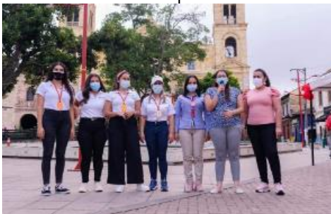
Evidencia informe de autoevaluación y el control 2022 SESAD

-Se realizó el fortalecimiento y apoyo a proyectos productivos de mujeres emprendedoras, entrega de insumos aves ponedoras, cerdas de cría, alimentos, y material para fabricación de unidad para 5 grupos de mujeres de la zona rural del Municipio.