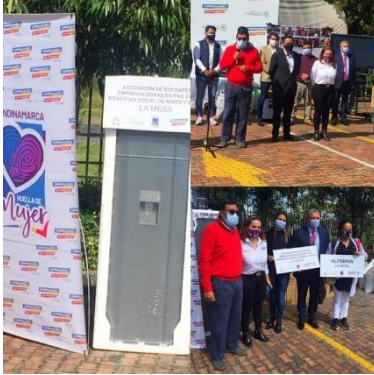
Evidencia informe de autoevaluación y el control 2022 SESAD

-Se realizó el acompañamiento a las postulaciones a nivel nacional y departamental con obtención de beneficios para las organizaciones y asociaciones de mujeres como asociación alfarían, asomaclana.