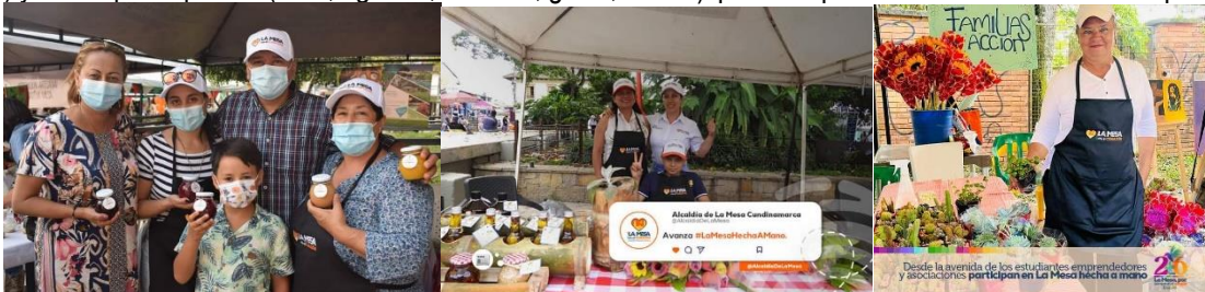
Evidencia encuentros provinciales mujeres emprendedoras SESAD

Proyectada desde el año 2021 anualmente se desarrolló el encuentro provincial de mujeres denominado de "Expo Mujer" o "La Mesa Hecha a Mano" lo cual permitió generar un espacio propicio para la comercialización de productos y servicios que ofertan las mujeres mesunas, contribuyendo así a su empoderamiento económico esta actividad se ha ejecutó en articulación con la Secretaria de Desarrollo Económico y turístico en el marco del día de la mujer rural, el encuentro contaba con entrega de alimentación (Refrigerio 1, almuerzo, refrigerio 2 ) y kit de participación (Tula, agenda, delantal, gorra, esfero) para 2 representantes de cada unidad productiva.