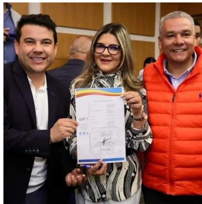
Evidencia radicado y firma de convenio proyecto casa de la mujer SESAD