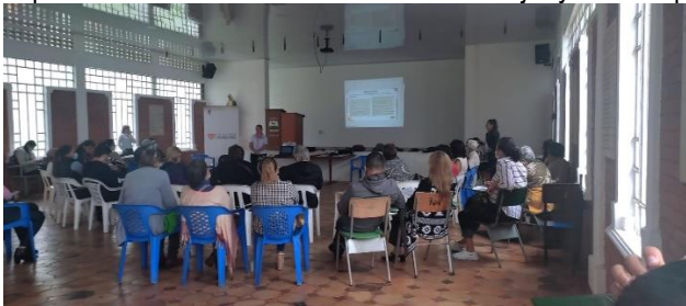
Evidencia informe de autoevaluación y el control 2022 SESAD

-Se realizo plan estratégico en la implementación de la Política Publica de mujer y género teniendo en cuenta las metas del Programa LA MUJER EN EL CORAZÓN, se presento ante el COMPOS los avances de la implementación de la Política Publica de Mujer y Género para el Municipio de La Mesa, Cundinamarca.