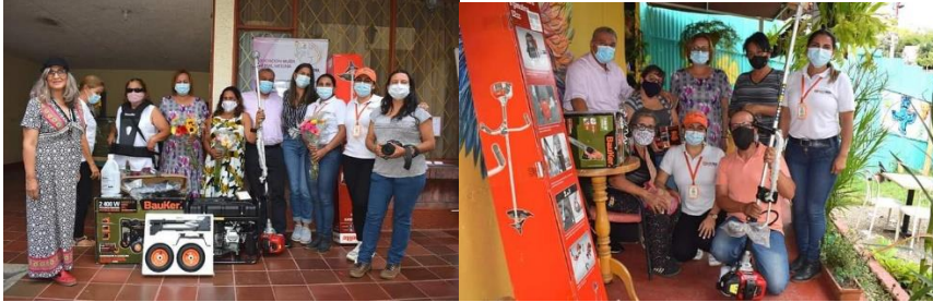
Evidencia informe de autoevaluación y el control 2021 SESAD

Proyectada desde el año 2021 se documentó y convocó al proceso de apoyo y fortalecimiento de asociaciones de mujeres Mesunas legalmente constituidas, se realizó proceso contractual de máquinas y herramientas a 5 asociaciones de mujeres entre ellas AMURUMA, ALFRIPAN, QUINTY, ARTESANOS UNIDOS, TEJIENDO SUEÑOS Y ESPERANZAS con una inversión de diez millones de pesos.