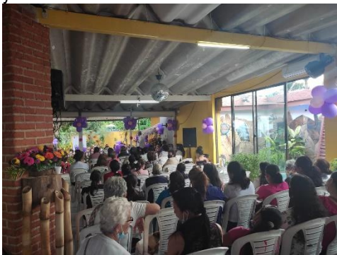
Evidencia informe de autoevaluación y el control 2022 SESAD

Se realizó encuentro de lideresas con espacio de bienestar, entrega de incentivos y capacitación en autoesquemas y empoderamiento femenino en conmemoración del día de la mujer, exaltando la labor de cada mujer lideresa en su sector, se tuvo en cuenta la participación de: grupos de mujeres, concejalas, bomberas, cuerpo de salud, presidentas de juntas, mujeres de la central de abastos del Tequendama, damas rosadas, veedoras, colectivos, fuerzas públicas, mujeres recolectoras, voluntariados, mujeres cuidadoras y funcionarias de la administración Municipal, espacio que permitió la interacción de las mujeres Mesunas y las lideresas Municipales, exaltando los derechos de las mujeres y contribuyendo al cumplimiento de estos; para el mes de octubre se ejecutó el encuentro de la Mesa hecha a mano con la participación de 30 unidades productivas de mujeres en una feria que permitió contribuir al ámbito económico de las mujeres dada la comercialización de sus productos, finalmente para el mes de noviembre se conmemoró el día de la no violencia contra la mujer mediante evento público en cabeza de una marcha, seguida por una velatón y el desarrollo de una obra de teatro con participación de actores reconocidos a nivel nacional que permitió la integración de toda la población visibilizando las acciones violentas a las que pueden estar sometidas las mujeres desde los diferentes ámbitos y cómo actuar sin normalizar la violencia de género.