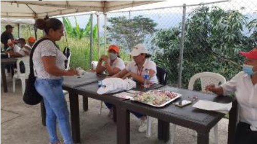
Evidencia informe de autoevaluación y el control 2022 SESAD

- Se Realizo capacitación en temáticas relacionadas con la prevención de violencia, rutas de atención y liderazgos femeninos.