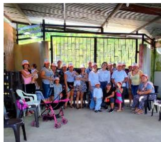
Evidencia entrega de insumos mujer emprendedora 2022 SESAD