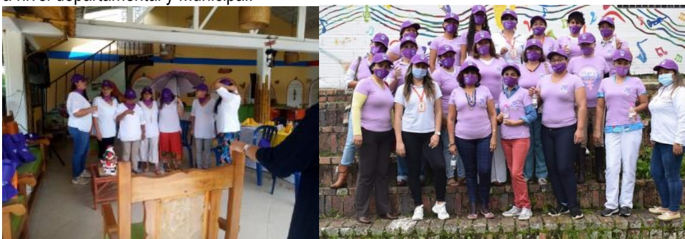
Evidencia informe de autoevaluación y el control 2021 SESAD

- Se realizo encuentro de consejeras consultivas con espacios de entretenimiento y capacitación, adquisición de camisa y pañoleta que permitiera la identificación de las consejeras en los diferentes encuentros y eventos a nivel departamental y Municipal.