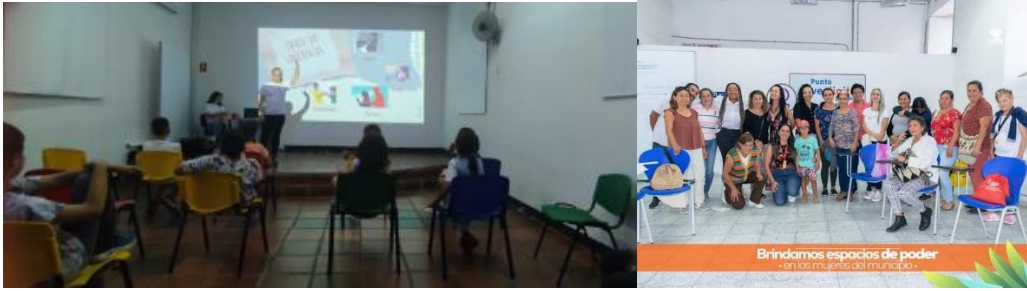
Evidencia taller colectiva lilithes 2022 SESAD