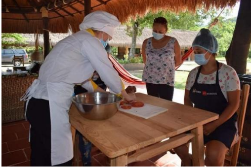
Evidencia entrega de insumos y capacitación proyectos productivos 2022 SESAD

-Se articuló capacitación a grupos de mujeres, articulación con institución educativa ICSEF y SENA, desarrollo de talleres de cocina para población de la inspección de San Joaquín y educación complementaria en cocina para madres gestantes y lactantes del programa GEN CERO.