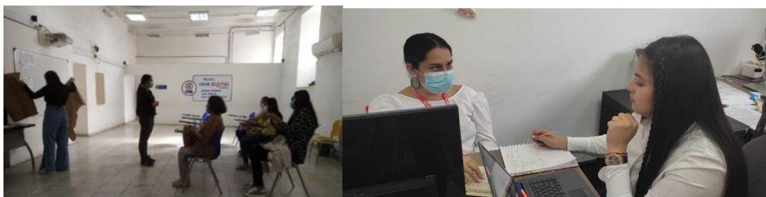
Evidencia informe de autoevaluación y el control 2021 SESAD

- Se realizó el informe diagnóstico de la necesidad de la actualización y ajuste de la Política Pública de Mujer y Género del Municipio de La Mesa, y se realizaron los encuentros correspondientes con las diferentes dependencias de la administración.