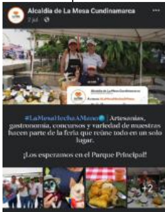
Evidencia informe de autoevaluación y el control 2022 SESAD