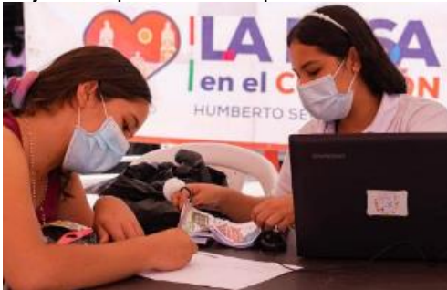
Evidencia feria de empleo 2020 SESAD

Durante el cuatrienio se realizó anualmente la ejecución de ferias de empleos Municipales con ofertas para mujeres, capacitación complementaria en confección de prendas.